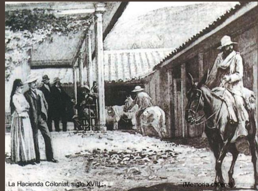
La Hacienda Colonial, siglo XVIII.

Hacia la década de 1880, se inició una etapa de estancamiento en los cambios descritos, debido a que el mundo rural chileno no pudo competir con nuevos productores agrícolas como Argentina o Australia. Como consecuencia , una gran cantidad de población ya había abandonado el mundo rural . Primero, se había dirigido a zonas mineras , pero incluso durante el auge de la industria salitrera, estas carecían de condiciones para acoger a tantas personas. La mayoría, por tanto, se dirigió a las ciudades en busca de ocupaciones vinculadas con la construcción de obras públicas, la actividad portuaria y un naciente proceso de industrialización .